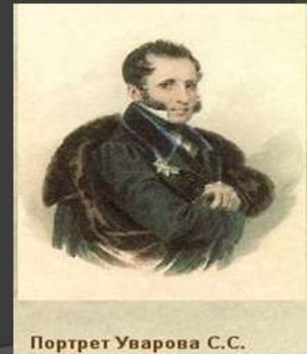
Портрет Уварова С.С.