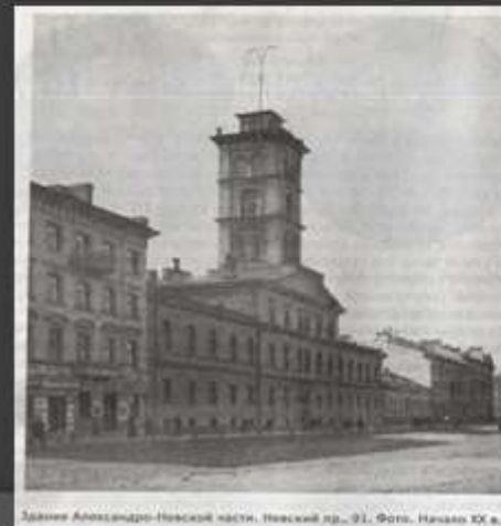
Здание Александро-Невской части, Невский пр., 91. Фото. Начало XIX в.